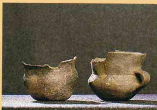
Gravfunn fra Tanum, 300-tallet.