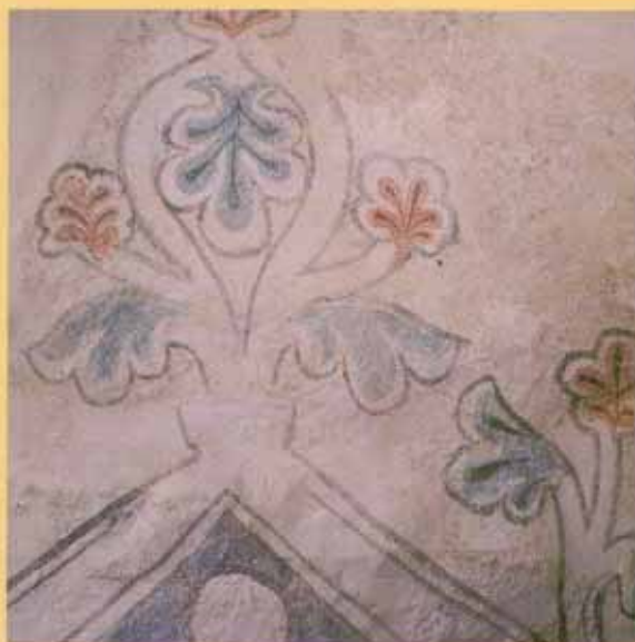
Kalkmaleri fra 1300-tallet, Tanum kirke.

Tanum og Haslum kirker i Bærum er begge fra midten av 1100-tallet og i bruk i dag. Begge er bygget som romanske steinkirker med avlangt rektangulært skip og smalere kor. Haslum ble utvidet til korskirke i høy-middelalderen. Kalkmaleriene fra 1300-tallet i Tanum kirke er unike.