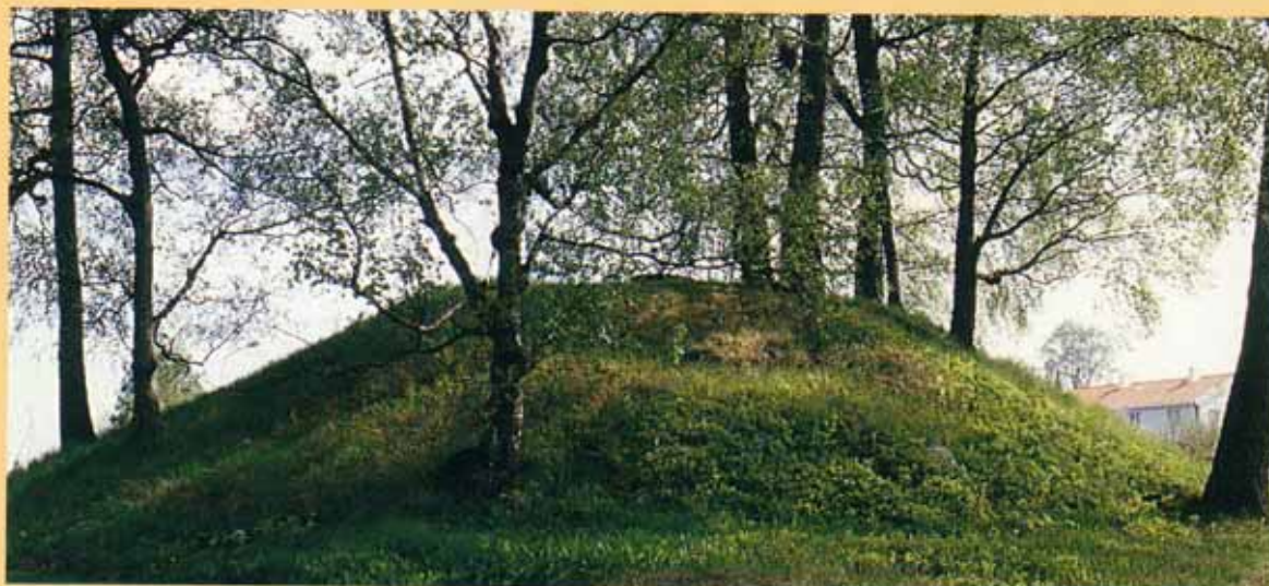
Gravhaug ved Tanum.

Gravhauger ved Tanum. Annikhaugen i Lommedalen med 7 gravrøysen ved golfbanen. Gravfelt i Holen skog langs Pilegrimsleden. Gravhaug i Angerstveien. Gravfelt med røysen på Høvikodden. Gravfelt med røysen på Risfjellet.