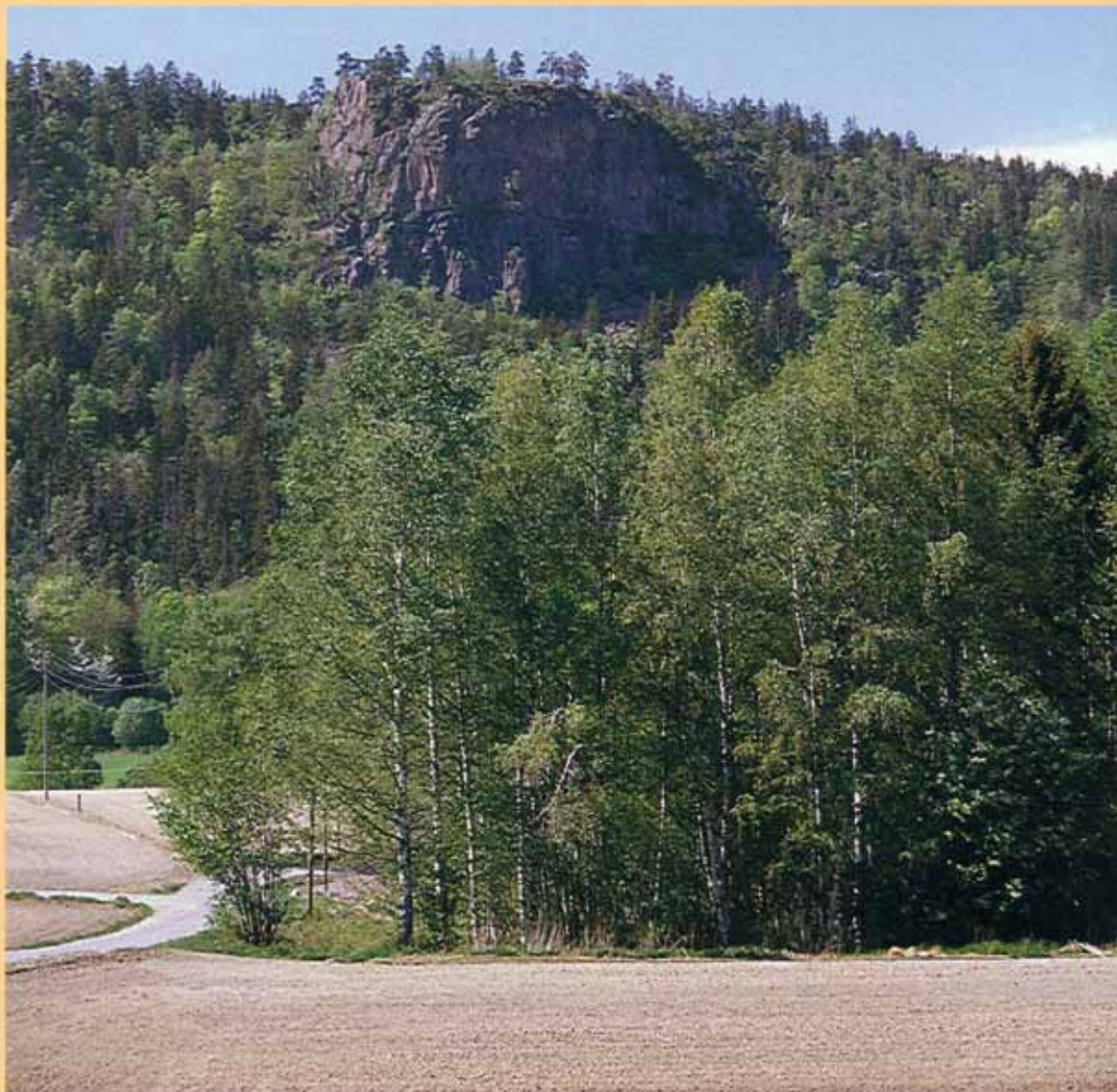
Gråmagan ved Dalbo.