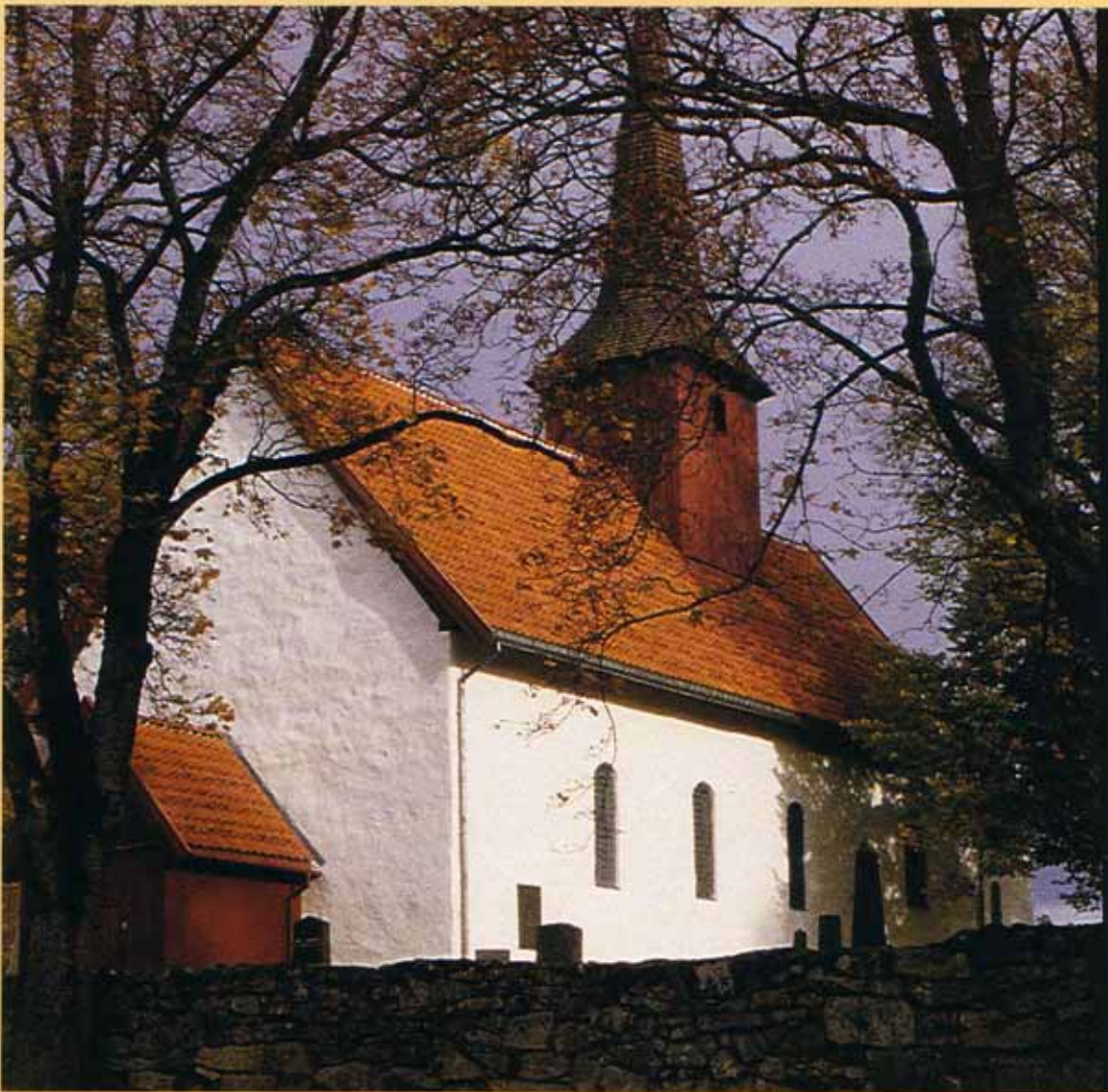
Tanum kirke.