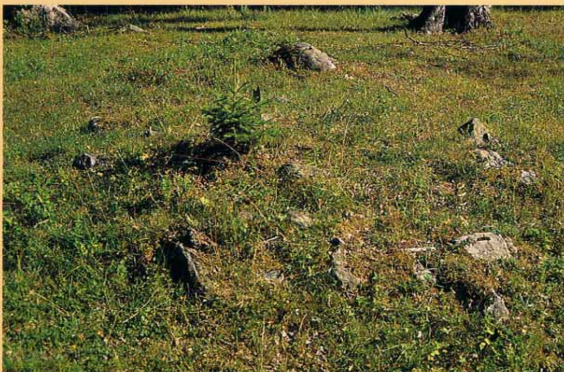
Rydningrøys.

I Bærum finnes fossile åker på Tanum, i Holen skog i Bærumsmarka og i Larshavna i Lommedalen.