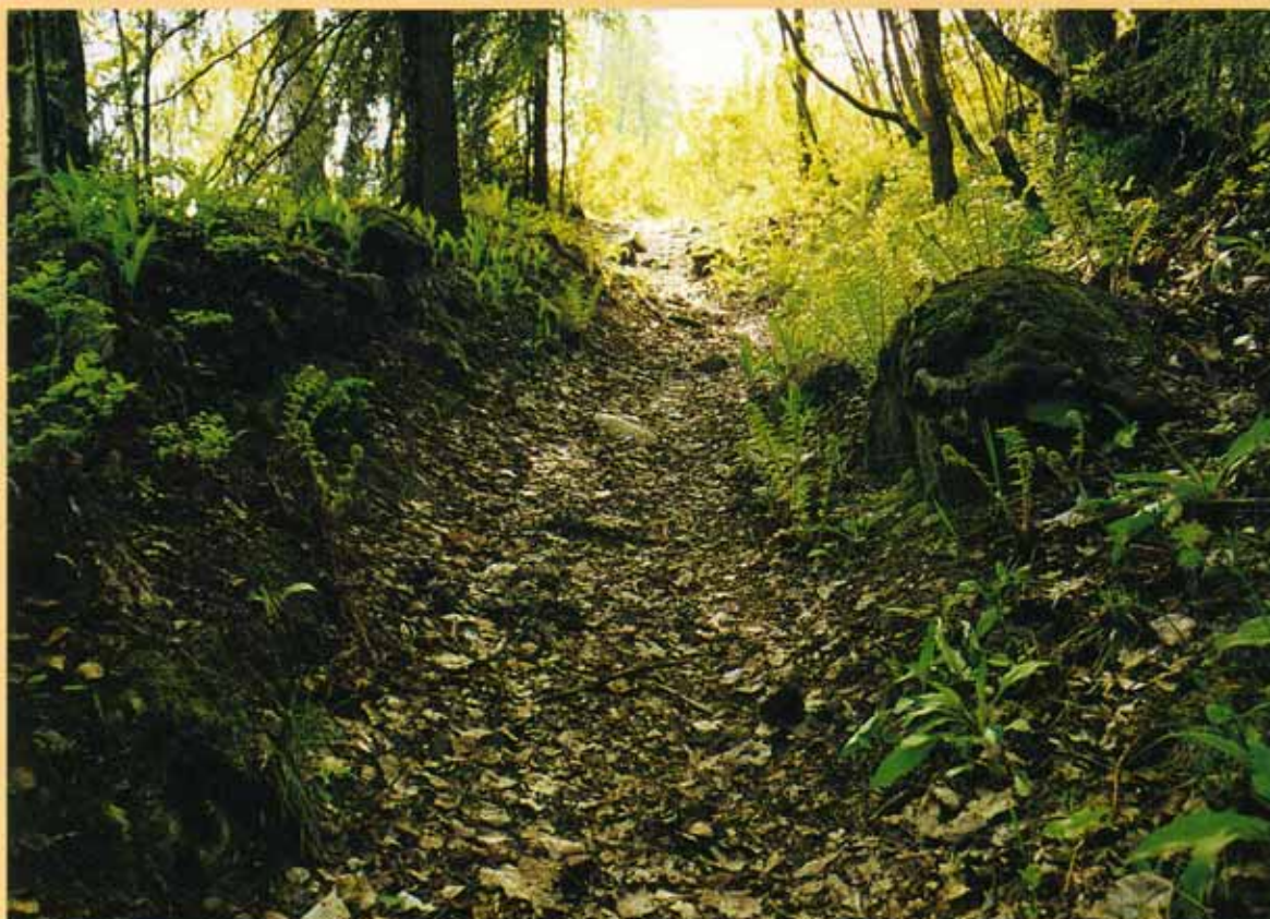
Hulvei mellom Haug og Tanum.

Larshavna mellom Skollerudveien og Annikveien i Lommedalen, Haug gård - Tanum kirke