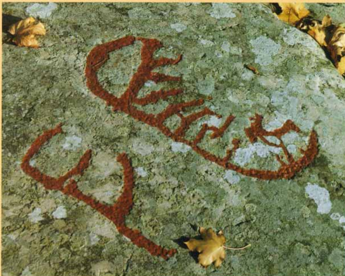
Helleristninger fra Dalbo.