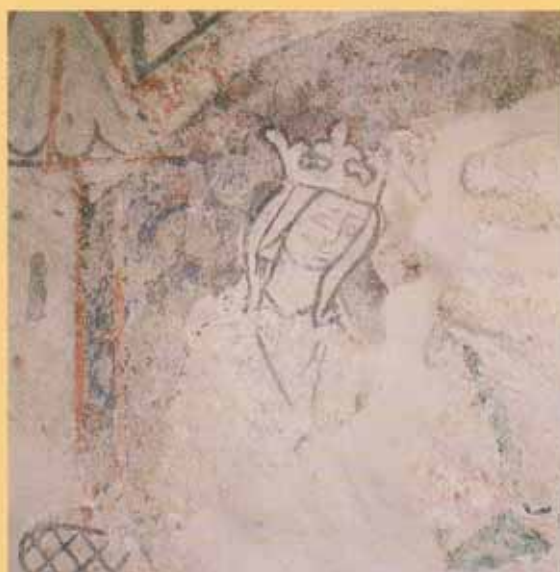
Kalkmaleri fra 1300-tallet, Tanum kirke.

Beliggenheten er som oftest på et høydedrag, omkranset av kirkegården, tett inntil den gamle ferdssveien og med godt utsyn til landskapet omkring. Kirken kunne være lagt inntil tunet på storgården og være finansiert av storbonden, eller den kunne være bygget i fellesskap av gårdeiere og bønder. Ofte ligger kirkene nær jernalderens kultplasser, tingsteder og gravfelt med synlige hauger. Med religionsskiftet fra hedendom til kristendom vitner funnene om et kontinuerlig bosetningsmønster, om opprettholdelse av bygdesentra og om bruk av de samme gravplassområdene. Kirkene er bygget i perioden fra år 1000 til reformasjonen i 1537. Inndelingen av kirkesogn skjedde rundt år 1150.