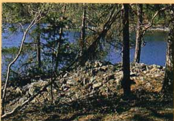
Gravrøys på Oustøya.

Haugene eller røysene har ofte et søkk eller en sjakt på toppen. Det kan være fordi graven er røvet eller at gravkammeret er sunket sammen. Graven kan fortelle om individet, samfunnet og tiden. Variasjonene er store. Forskningen prøver å sette sammen et puslespill der gravrøysen og hauger er viktige brikker i å forstå fortidens samfunn ut fra materielle spor.